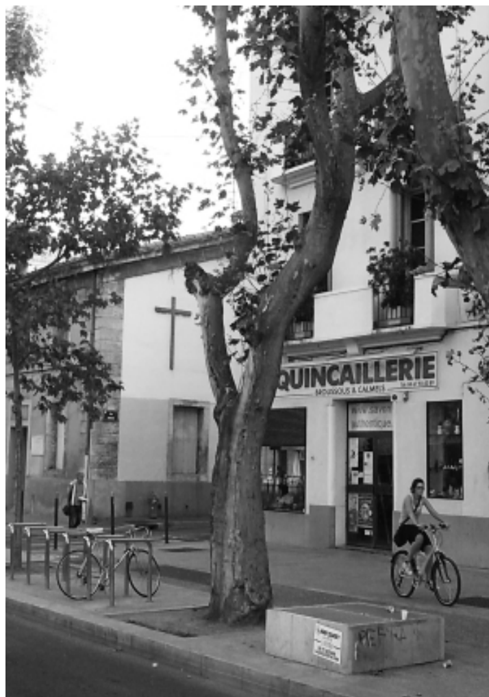
Le temple de la rue Brueys fait débat entre les riverains, les commerçants, et les associations protestantes

La mission Grand Cœur a depuis repris contact avec nous à propos du choix du nom du projet. Nous souhaitons que celui-ci reflète l'ouverture du lotissement sur le faubourg car nous ne voulons pas d'un enclos de résidences sécurisées sans aucun bénéfice pour le quartier. De nouveaux espaces verts, une place publique, une salle collective : Tout cela doit être accessible ! Nous attendons la réunion publique pour constater l'avancée du projet et la prise en compte de nos observations et de nos souhaits pour le quartier.