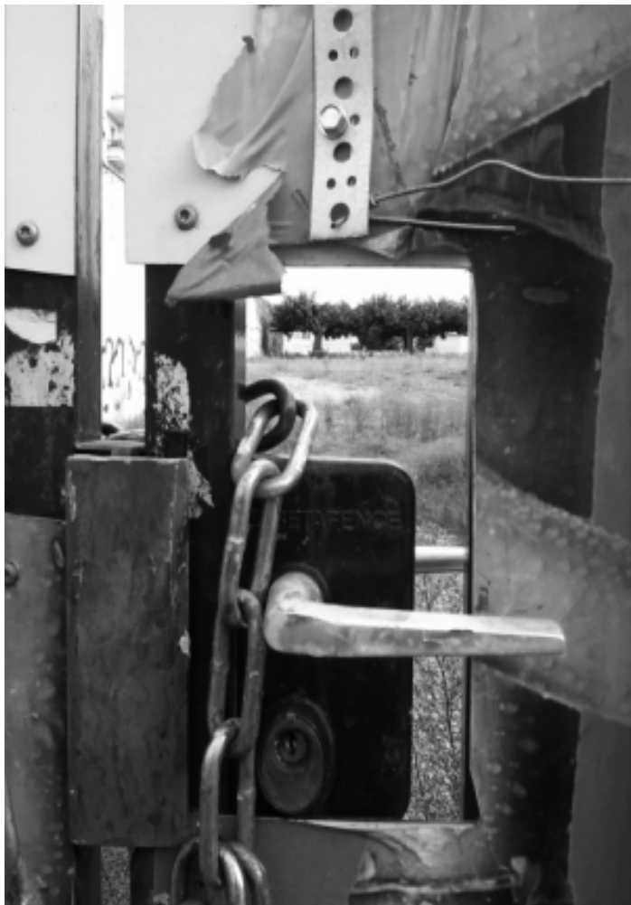
Pierre Mendès France : vue de l'allée de mûriers au travers des palissades

Clerongambe s'implique dans le dossier du futur ilot immobilier de l'ancien Lycée. Nous avons interpellé cet été, comme vous le savez, la mairie et les architectes. Le Maire a fait une réponse détaillée à nos questions et inquiétudes. Si la lettre est encourageante certaines choses ne sont pas réglées notamment les équipements publics et les établissements scolaires "oubliés".