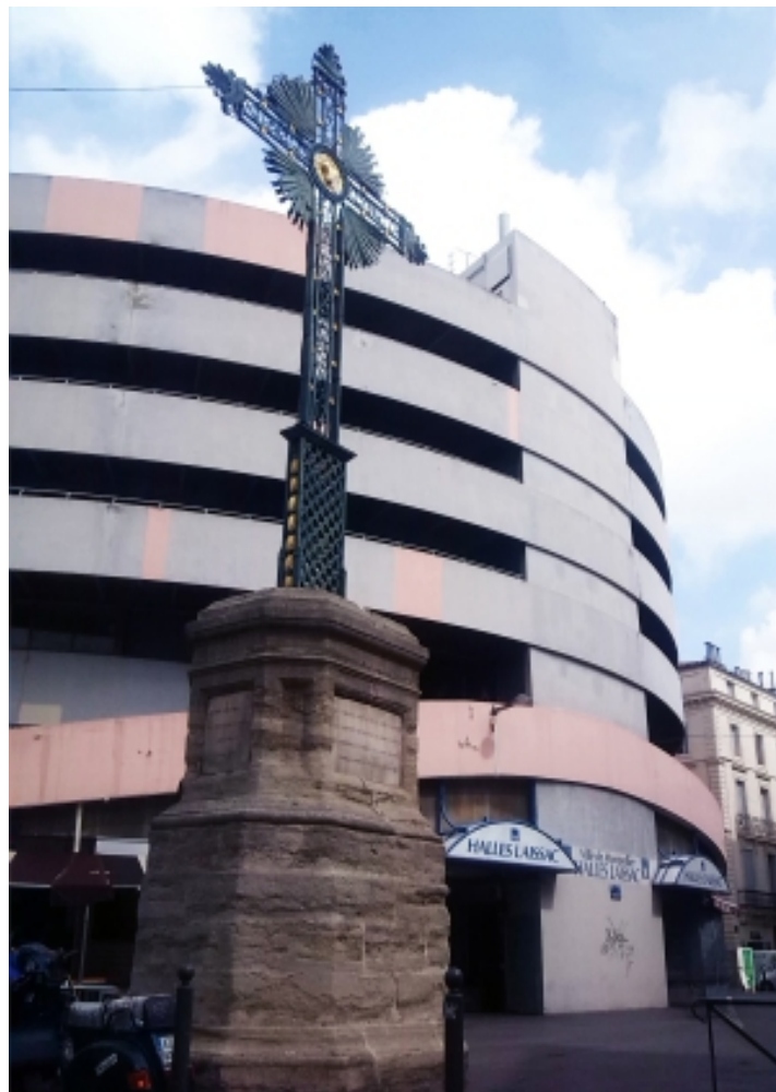
Inscription du Calvaire à l'immense croix des Halles Laissac "Les empires s'écroulent, la croix demeure, Les sceptres se brisent, la croix demeure, Les couronnes tombent, la croix demeure."

Clerondegambe a communiqué à plusieurs reprises à propos de ces halles. Le Comité de quartier a commencé une campagne de sondage pour connaître la fréquentation du marché, les moyens de transports utilisés pour y accéder et l'utilisation de son fameux parking... Nous vous tiendrons informés des résultats de l'enquête.