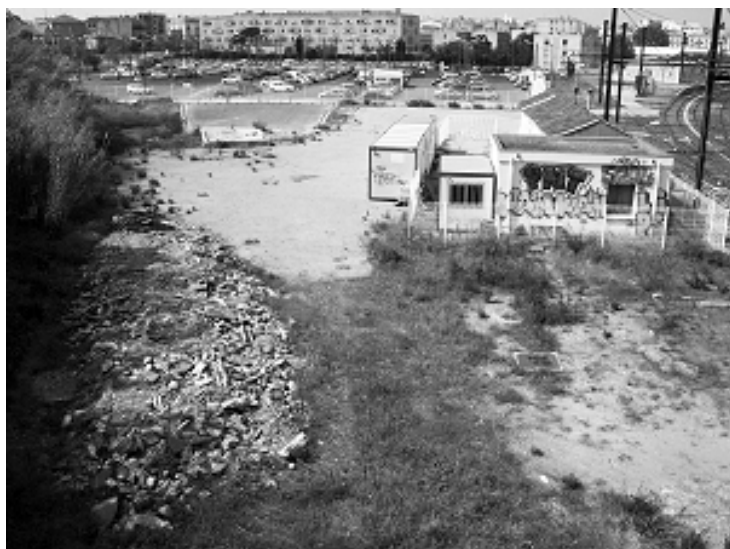
La friche du Nouveau St Roch

La réunion publique du 4 juillet à la maison de la démocratie nous a laissé sur notre faim. Le projet n'a pas évolué ou alors dans le mauvais sens.