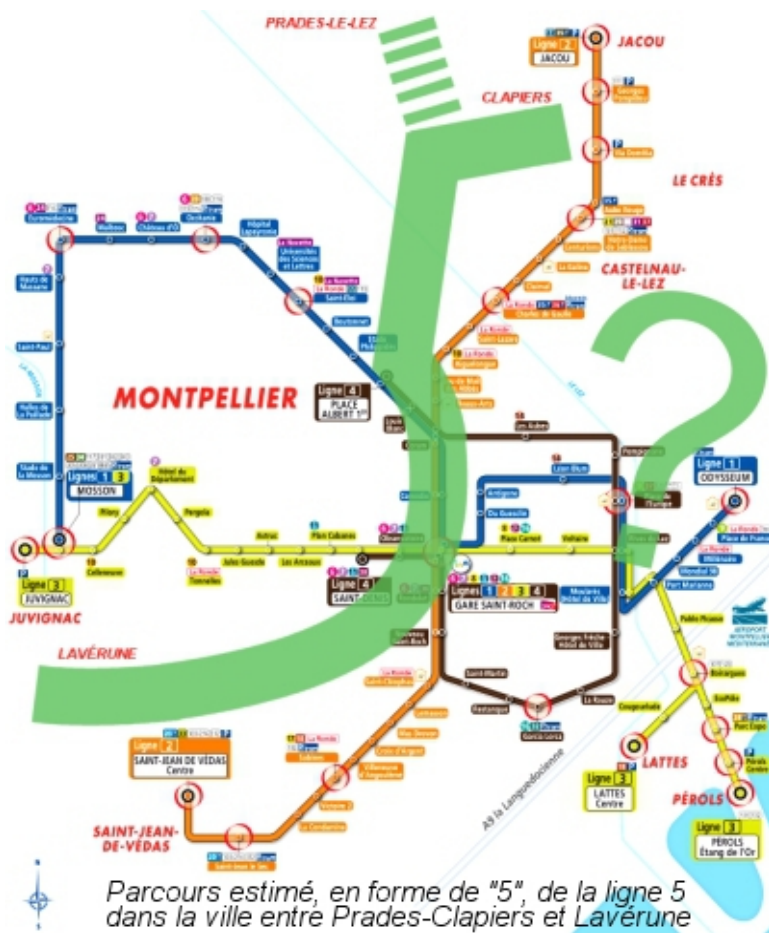
Parcours estimé, en forme de "5", de la ligne 5 dans la ville entre Prades-Clapiers et Lavérune